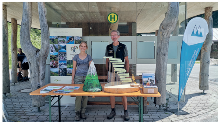
© Naturpark Weißbach, Sandra Uschnig & Josef Egger

Natur kennt keine Grenzen – denn der Lebensraum hört nicht an der Landesgrenze zwischen Salzburg und Bayern auf. So wird in den beiden Schutzgebieten auch über die Grenze hinweg zusammengearbeitet. Etwa gibt es diesen Sommer mehrere gemeinsame Infostände (siehe Foto) am Hirschbichl, also im Übergangsbereich vom Nationalpark zum Naturpark. Dabei werden BesucherInnen und Gäste informiert, die zwischen den Bergsteigerdörfern Weißbach und Ramsau unterwegs sind – ob zu Fuß, mit dem Bike oder dem AlmErlebnisBus. Infos unter: www.naturpark-weissbach.at