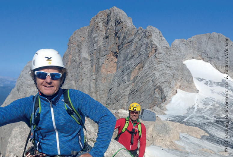
© JO Saizburg, Rudi Wienerroither & Andreas Widauer